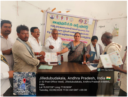
చేస్తున్నామని తెలిపారు. అందులో భాగంగానే రాజముద్రతో కూడిన పాస్ పుస్తకాలను రైతులకు అందిస్తున్నామని పేర్కొన్నారు. రైతుల హక్కులు, గౌరవాన్ని పరిరక్షించడమే ప్రభుత్వ ప్రధాన లక్ష్యమని స్పష్టం చేశారు. రైతుల పేరుతో రాజకీయ ప్రయోజనాలను పొందేందుకు ఎవరైనా ప్రయత్నిస్తే సహించబోమని హెచ్చరించిన అమె, రైతు సంక్షేమమే ప్రభుత్వ ప్రధాన అజెండా అని అన్నారు. రైతుల సమస్యల పరిష్కారానికి ప్రభుత్వం ఎల్లప్పుడూ

దేవనకొండ, జూన్ 2 (ప్రజా విపిణ్ణిక్ న్యూస్):- రైతుల గౌరవాన్ని పునరుద్ధరించే దిశగా రాష్ట్ర ప్రభుత్వం చేపట్టిన రాజముద్ర పాస్ పుస్తకాల పంపిణీ కార్యక్రమంలో భాగంగా దేవనకొండ మండలం జిల్లాబుడుకల గ్రామంలో 744 మంది రైతులకు రాజముద్రతో కూడిన రైతు పాస్ పుస్తకాలను పంపిణీ చేశారు. రాష్ట్ర వ్యాప్తికి కార్పొరేషన్ చైర్మన్ కప్పట్రాళ్ల బోజ్జమ్మ చేతు మీదుగా ఈ కార్యక్రమం ఘనంగా నిర్వహించబడింది. కార్యక్రమంలో ఎంఆర్ఓ రామేశ్వర్ రెడ్డి పాల్గొని రైతులకు పాస్ పుస్తకాలను అందజేశారు. ఈ సందర్భంగా బోజ్జమ్మ మాట్లాడుతూ, రైతుల ఆస్తులు, హక్కులకు సంబంధించిన పాస్ పుస్తకాలపై రాజకీయ ప్రచారం చేయడం రైతుల ఆత్మగౌరవాన్ని దెబ్బతీసే చర్య అని పేర్కొన్నారు. గత ప్రభుత్వం రైతుల పాస్ పుస్తకాలపై తమ ఘోటోలను ముద్రించి వ్యక్తిగత ప్రచారానికి వేదికగా మార్చిందని విమర్శించారు. గౌరవ ముఖ్యమంత్రి నారా చంద్రబాబు నాయుడు నాయకత్వంలో రైతు సంక్షేమానికి ప్రాధాన్యత ఇస్తూ పలు సంస్కరణలు అమలు