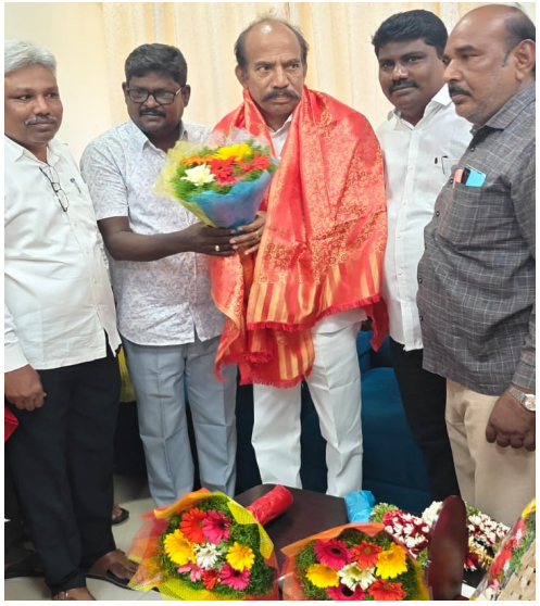
క్రైస్తవులకు ఎస్సీ హోదా. దళితులకు మత స్వేచ్ఛ, అన్ని ప్రభుత్వ శాఖలలో రోస్టర్ బుక్ నిర్వహణ. అన్ని ప్రభుత్వ శాఖలలో క్యాడర్ స్ట్రాంట్ ప్రకటించి, తగినంత, రిజిస్ట్రేషన్ రోస్టర్ లను పరిశీలన, అర్హత కలిగిన ఎస్సీ, ఎస్టీ ఉద్యోగులతో భర్తీ చేయాలి.