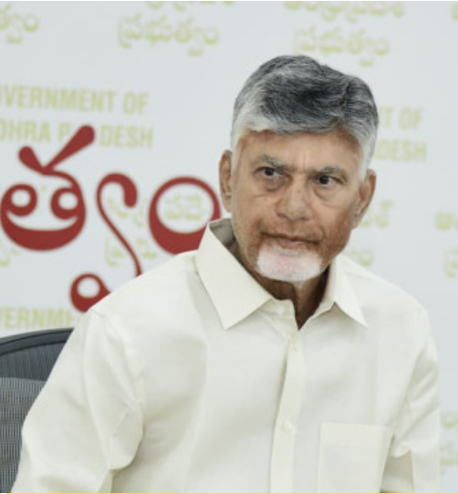
ఆక్యా రైతులకు భారీ ఊరట వ్యవసాయం, అనుబంధ రంగాలపై సీఎం చంద్రబాబు సమీక్ష కొత్త ఆక్యా కనెక్ట్ కు విద్యుత్ సబ్సిడీ అధికారులకు కీలక ఆదేశాలు

రైతుల ముంగిటకే మార్కెట్.. రైతు ఉత్పత్తులను నేరుగా వినియోగదారులకు చేర్చే 'ఫార్మ్ టు హోమ్' విధానం యడవోలు వద్ద కోకో సిటీ ఏర్పాటుకు పరిశీలన జూలైలో అగ్రికల్చర్ స్మార్ట్ కు శంకుస్థాపన రైతు బజార్లలో ప్రకృతి సేద్య ఉత్పత్తులకు ప్రత్యేక కౌంటర్లు