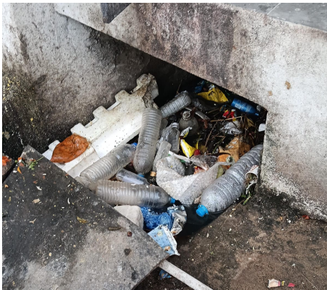
కర్నూలు ప్రతినిధి (లపబ్లీక్ న్యూస్ మే 19)

ఓటీపీలు, టార్గెట్లు, సానుకూల సమాధానాలే లక్ష్యం - మురుగు కాలువల మధ్య 'స్వచ్ఛ నగరం' ప్రచారం