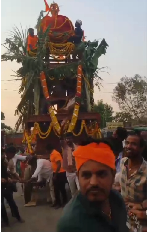
అలరించాయి. మంగళ వాయిద్యాలు కార్యక్రమానికి ప్రత్యేక ఆకర్షణగా నిలిచాయి. హారతులు ఇస్తూ భక్తులు స్వామివారిని దర్శించుకున్నారు. అనేక మంది

దేవనకొండ, మే 12 ( ప్రజా రిపబ్లిక్ న్యూస్): - దేవనకొండ క్రాస్ రోడ్లో శ్రీ ఆంజనేయస్వామి రథోత్సవం భక్తి శ్రద్ధల సదుమ ఘనంగా నిర్వహించారు. హనుమాన్ జయంతి సందర్భంగా ఆలయ ప్రాంగణం ఆధ్యాత్మిక శోభతో కళకళలాడింది. ఉదయం నుంచే భక్తులు భారీ సంఖ్యలో ఆలయానికి తరలివచ్చారు. స్వామివారికి ప్రత్యేక అభిషేకాలు, అర్చనలు నిర్వహించారు. పండితులు వేదమంత్రాల సదుమ ప్రత్యేక పూజలు చేపట్టారు. ఆలయాన్ని విద్యుత్ దీపాలతో సర్వాంగ సుందరంగా అలంకరించారు. పూలతో చేసిన అలంకరణలు భక్తులను ఆకట్టుకున్నాయి. హనుమాన్ మాలధారులు ప్రత్యేకంగా పాల్గొన్నారు. స్వామివారి దర్శనం కోసం భక్తులు భారులు తీరారు. అనంతరం శ్రీ ఆంజనేయస్వామి ఉత్సవ విగ్రహాన్ని ప్రత్యేకంగా అలంకరించిన రథంపై ప్రతిష్ఠించారు. రథోత్సవాన్ని ఆలయ అర్చకులు మంత్రోచ్ఛారణల మధ్య ప్రారంభించారు. భక్తులు “జై శ్రీరామ్”, “జై హనుమాన్” నినాదాలతో ప్రాంతాన్ని మార్చోగించారు. రథం దేవనకొండ ప్రధాన వీధుల గుండా ఊరేగింది. రథోత్సవంలో మహిళలు, యువత, చిన్నారులు ఉత్సాహంగా పాల్గొన్నారు. భజన బృందాలు ఆధ్యాత్మిక గీతాలతో భక్తులను