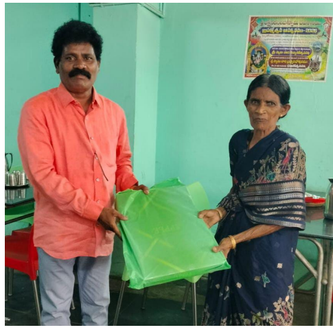
అందించి చిన్నారిలో ఆనందం నింపారు. శ్రీనివాసులు చేస్తున్న సేవా కార్యక్రమాన్ని స్థానికులు అభినందించారు. సేవా కార్యక్రమాలను మరింత మందికి అందించి ఇతరులకు స్ఫూర్తిగా నిలవాలని వారు ఆకాంక్షించారు.