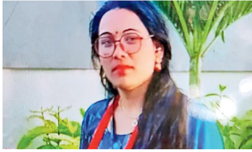
అపోలో నాంపల్లికి వెళ్లి, అక్కడి నుంచి తెలంగాణ ఎక్స్ప్రెస్లో నాగ్ పుర్ వెళ్ళు పారిపోయినట్లు గుర్తించారు. అయితే, పోలీసులను తప్పుదోవ పట్టించేందుకు నిందితులు మార్గమధ్యంలోనే రైలు దిగిపోయి ఉంటారని అనుమానిస్తున్నారు. కొన్ని టాస్కోఫోర్స్ బృందాలు శుక్రవారం సాయంత్రానికి నేపాల్ సరిహద్దులకు చేరుకున్నట్లు సమాచారం. ఈ దోపిడీ, హత్య వెనుక పక్కా ప్రణాళిక ఉందని

విశ్రాంతం ఏపీఎస్ అధికారి భార్య హత్య కేసులో దర్యాప్తు ముమ్మరం పనిమనిషి కల్పన ప్రధాన నిందితులని పోలీసుల నిర్ధారణ నిందితుల కోసం నేపాల్ సరిహద్దులో గాలింపు పక్కా పథకం ప్రకారమే దోపిడీ, హత్య జరిగిందని అనుమానం