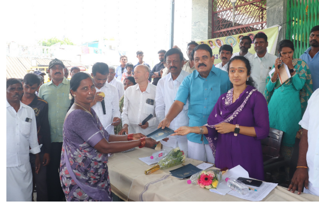
శ్రీ సత్యసాయి, అమడగూరు, మే 06. (లపజిక్ న్యూస్)