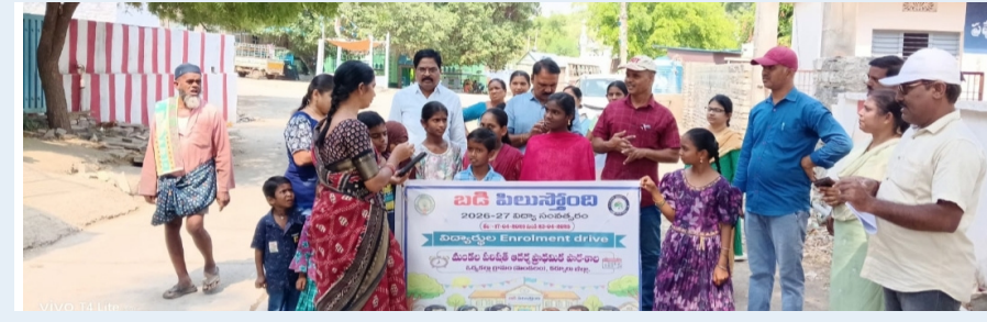
ఓర్వకల్లు ప్రతినిధి, మే 6 (లపజిక్ న్యూస్)

పేరుకు గౌరవ వేతనం పేరుతో పని భారం మాత్రం పెంచారన్నారు, పెంచిన పని భారం తగ్గించాలని, అంగనవాడీ వర్కర్ల మాదిరిగానే ఆశ వర్కర్లకి సెలవులు ఇవ్వాలని వారు కోరారు. కాల్ పోస్టులు భర్తీ చేయాలని, నాణ్యమైన యూనిఫాం , మొలైల్ ఫోన్స్, ఇవ్వాలని, ఏఎన్ఎం, జిఎన్ఎమ్, పర్మినెంట్ పోస్టులకు, ప్రాధాన్యత ఇవ్వాలని, ఖర్చులు ఇవ్వాలని, కోరారు. ఈమిఎఫ్, గ్రాడ్యుటీ, 10 లక్షల ఇన్సూరెన్స్, అమలు చేయాలన్నారు. సమస్యల పరిష్కారం కోసం, అంగన్వాడీల పోరాట స్ఫూర్తితో, ఆశ వర్కర్ల బక్యంగా పోరాడి తమ హక్కులను సాధించుకోవాలని సిబిటియూ ఆశ వర్కర్స్ యూనియన్ కు పిలుపునిచ్చారు.