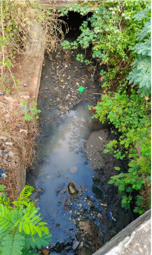
ఓబులవారిపల్లి మే 6 రిపబ్లిక్ న్యూస్.

ఓబులవారిపల్లి మండలం గోవిందం పల్లి గ్రామంలో త్రాగునీరు కలుషితమై ప్రజలకు తీవ్ర అనారోగ్యాలు కలిగిస్తున్నాయి. కలుషిత నీటి సమస్య తీవ్రమవుతోంది. వెంటనే పరిష్కారం చేయకపోతే ఏపీఎండీసీ కార్యాలయం ఎదుట ఆందోళన చేపడతామని భారత కమ్యూనిస్టు పార్టీ సీపీఐ