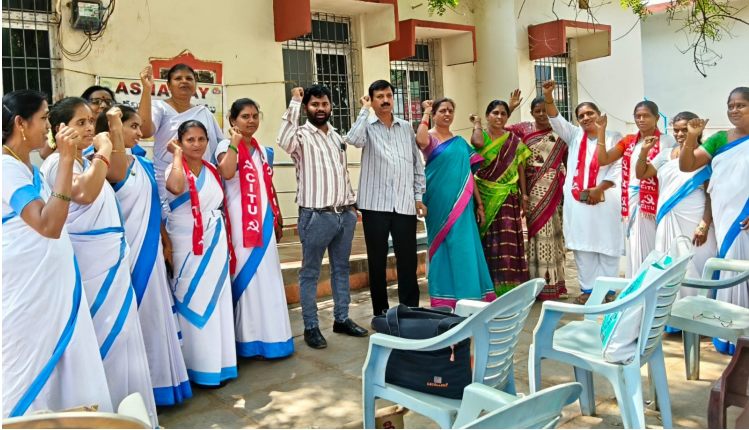
వేతనం, 26000 వేల రూపాయలకు పెంచాలని,