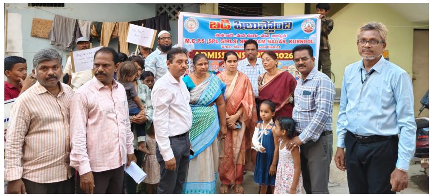
కర్నూలు ప్రతినిధి (లపజిక్ న్యూస్ మే 6)

అవగాహన రా్యాలీలు, అంగన్వాడీ సందర్శనలతో చేర్పుల ప్రోత్సాహం