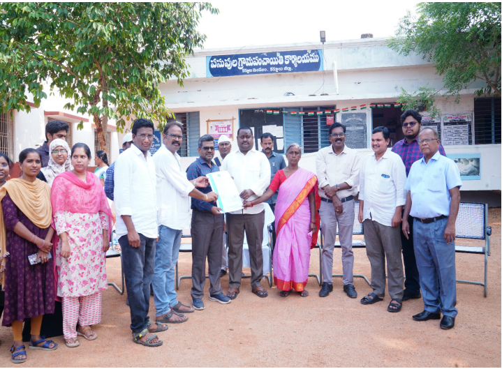
కర్నూలు ప్రతినిధి (లపజిక్ న్యూస్ మే 6)

పసుపుల గ్రామపంచాయతీ విశిష్ట ఘనత సాధించింది. కేంద్ర గ్రామీణ అభివృద్ధి శాఖ ఆదేశాలతో, రాష్ట్ర పంచాయతీరాజ్ శాఖ ఆధ్వర్యంలో నిర్వహించిన ఐఎన్ఓ సర్టిఫికేషన్ ప్రక్రియలో పసుపుల గ్రామపంచాయతీ ఎంపికై, ఉమ్మడి కర్నూలు జిల్లాలో ఈ గుర్తింపు పొందిన తొలి గ్రామపంచాయతీగా నిలిచింది. రాష్ట్రంలోని 26 జిల్లాల నుంచి రెండు చొప్పున మొత్తం 52 గ్రామపంచాయతీలను ఐఎన్ఓ సర్టిఫికేషన్ కోసం ఎంపిక చేయగా, తొలి విడతలో 24 పంచాయతీలకు ఈ ప్రక్రియ పూర్తిచేయబడింది. ఈ క్రమంలో పసుపుల గ్రామపంచాయతీ రాష్ట్రంలోని