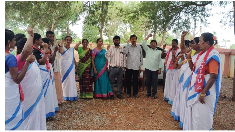
ఓబలవారిపల్లి మే 6 లపజిక్ న్యూస్