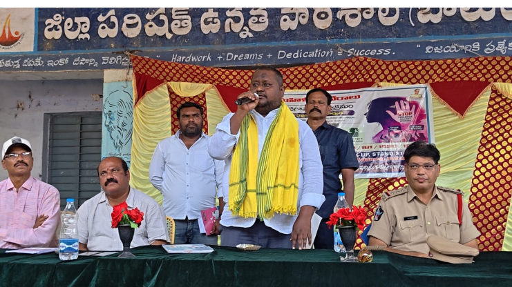
కర్నూలు ప్రతినధి (రెపబ్లిక్ న్యూస్ మే 3)

ఇంటర్లో ప్రతిభ కనబరిచిన విద్యార్థులకు ఎమ్మెల్యే బొగ్గుల దస్తగిరి సత్కారం