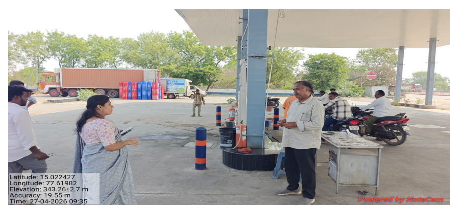
పెద్దపడుగుూరు ఏప్రిల్ 27 (రెవెన్యూ న్యూస్) వాహనదారులకు పెట్రోలు, డిజిల్ కొరత రానివ్వకుండా చూడాలని పెట్రోలు బంకుల యజమానులకు తహసీల్దారు ఉపారాణి సూచించారు. సోమవారం ఆమె మండలంలోని కాశేపల్లి, మిడుతూరు, పెద్దపడుగుూరు, అప్పేరెడ్ల ప్రాంతాల్లో ఉన్న పెట్రోలుబంకులను ఆమె పరిశీలించి తనిఖీలు చేపట్టారు. మండల వ్యాప్తంగా పది బంకులు ఉన్నాయని వీటిలో రెండుమాత్రమే నిల్వలు లేవని మిగతాచోట్ల డిజిల్, పెట్రోలు యధావిధిగా లభిస్తున్నదని ఎవరూ ఆందోళన చెందాల్సిన అవసరం లేదని ఆమె తెలిపారు. నిల్వలు ఉంచుకుని స్టాక్ లేదని బోర్డులు ఏర్పాటు చేస్తే వారిపై కఠిన చర్యలు తీసుకుంటామని ఆమె బంకు యజమానులకు సూచించారు. ఆమె వెంట వీఆర్ఎస్ఎ అంజి తదితరులు ఉన్నారు.

పాత్ర మరుపలేనిది. మానవతా దృక్పథం - దాగుణం: డొక్కల కరువు కాలంలో సేవ: 1790వ దశకంలో సంభవించిన భయంకరమైన 'డొక్కల కరువు' సమయంలో గంజి కేంద్రాలను ఏర్పాటు చేసి వేలాది మంది ప్రాణాలను కాపాడిన గొప్ప మానవతావాది. యాత్రికుల సౌకర్యం : కాశీ నుండి రామేశ్వరం వరకు వెళ్లే యాత్రికుల కోసం సత్రాలు నిర్మించి, అన్నదానాలు చేసిన 'దానకర్షణ' ఆయన బ్రిటిష్ పాలనా కాలంలో కూడా స్వర్ణరాన్ని కాపాడుతూ, ప్రజల సంక్షేమం కోసం అవార్డులు కృషి చేసిన అటువంటి మహనీయుని జయంతిని జరుపుకోవడం మనందరి బాధ్యత అని ఎస్పీ స్పష్టం చేశారు. ఆయన ధర్మగుణం, సేవా భావం నేటి తరానికి స్ఫూర్తిదాయకమని పేర్కొన్నారు. ఈ కార్యక్రమంలో జిల్లా పోలీస్ అధికారులు, సిబ్బంది పాల్గొని నివాళు లర్పించారు.