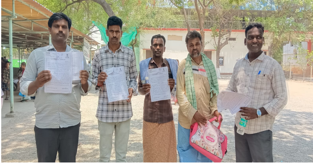
సంతానం, వారి కుటుంబ సభ్యులకు మొత్తం ఆస్తి వంశపాలు రావాల్సి ఉంది.