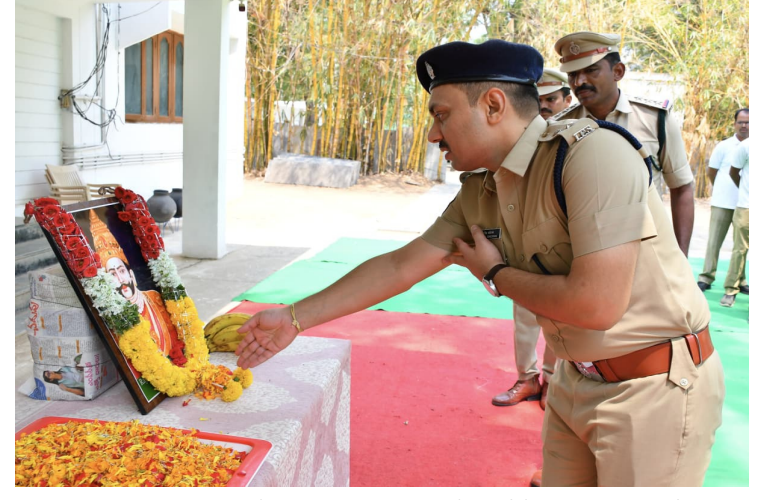
అమరావతిని రాజధానిగా చేసుకుని, ఆ ప్రాంతాన్ని గొప్ప ఆధ్యాత్మిక, సాంస్కృతిక కేంద్రంగా తీర్చిదిద్దిన ఘనత ఆయనకే దక్కుతుంది. దేవాలయాల నిర్మాణం: మంగళగిరిలోని ప్రసిద్ధ పాపకాల లక్ష్మీ సరసింహస్వామి క్షేత్రాల అభివృద్ధి: శ్రీశైలం, పొన్నూరు 11 అంతస్తుల గాలిగోపురం (దక్షిణ