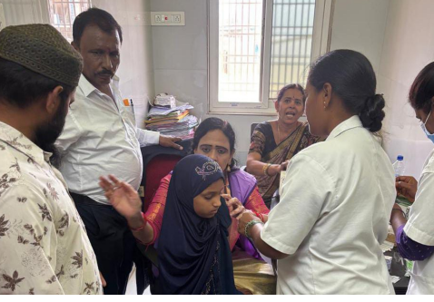
ఆరోగ్యంపై అవగాహన పెంపొందించడం ప్రతి ఒక్కరి బాధ్యత