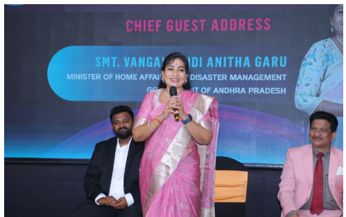
కార్యక్రమ వ్యవస్థ (రద్దు) చట్టం, 1976పై ఒక రోజు వర్క్ షాప్ నిర్వహించారు. ఈ వర్క్ షాప్ కు ముఖ్యఅతిథిగా హోంమంత్రి అనిత, డైరెక్టర్ ఆఫ్ ప్రాసిక్యూషన్స్

విశాఖపట్నం, ఏప్రిల్ 11 రిపబ్లిక్ న్యూస్ : చట్టాలు, న్యాయవ్యవస్థపై ప్రజలకు నమ్మకం పెరిగిందని ఆంధ్రప్రదేశ్ హోంమంత్రి వంగలపూడి అనిత వ్యాఖ్యానించారు. పబ్లిక్ ప్రాసిక్యూషన్ అండ్ ఒక గౌరవమని ఉద్ఘాటించారు. పోక్సో కేసుల్లో బెయిల్ రాకుండానే శిక్ష పడుతుందని స్పష్టం చేశారు. పోలీసు వ్యవస్థ, న్యాయ వ్యవస్థ సమన్వయంతో పని చేస్తే ప్రజలకు న్యాయం జరుగుతుందని పేర్కొన్నారు. శనివారం విశాఖపట్నంలో ఆంధ్రప్రదేశ్ ప్రాసిక్యూషన్ విభాగం అధ్యక్షులలో మాసవ అక్షరం రవాణా, బానిస