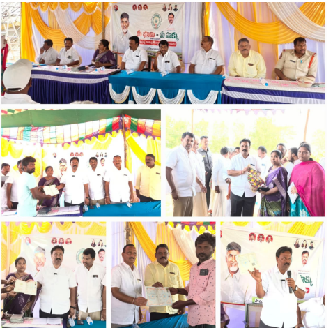
నిద్రలేని రాత్రులు గడిపారని, భూమి సరిహద్దు రాళ్ళపై కూడా అప్పటి ముఖ్యమంత్రి ఘోషించిన ముద్రించుకోవడంతో రైతులు తమ భూమి ఏమైపోతుంది అని ఆవేదన