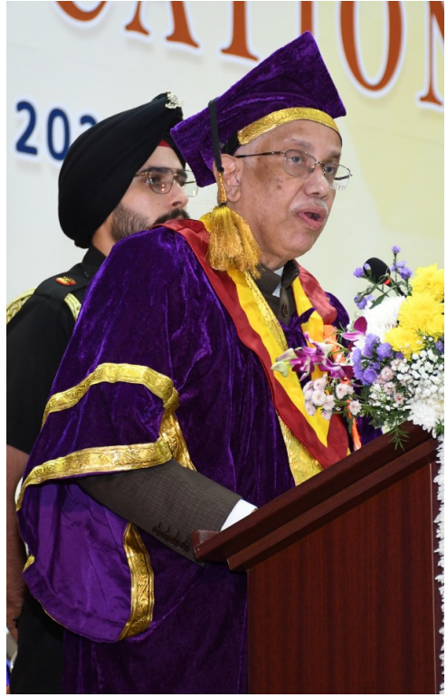
అనంతపురం జేఎన్టీయూ, ఏప్రిల్ 06, ( రిపబ్లిక్ న్యూస్ ):

సామాజిక అవసరాలకు అనుగుణంగా పరిశోధన, సాంకేతిక అభివృద్ధిలు సుస్థిర అభివృద్ధి ముందుకు తీసుకెళ్ళగా బలమైన సామర్థ్యం మన ఆంధ్రప్రదేశ్ రాష్ట్రానికి ఉందని రాష్ట్ర గవర్నర్ అబ్దుల్ సజీద్ తెలిపారు. సోమవారం అనంతపురం జేఎన్టీయూ ఎన్టీఆర్ ఆడిటోరియంలో జరిగిన 15వ స్నాతకోత్సవానికి గవర్నర్ ఛాన్సలర్ హోదాలో, ముఖ్య అతిథిగా హాజరై వేడుకలకు శోభను చేకూర్చారు. అంతకుముందు జేఎన్టీయూ అతిథి గృహం వద్ద గవర్నర్ పోలీసు గౌరవ వందనం స్వీకరించారు.