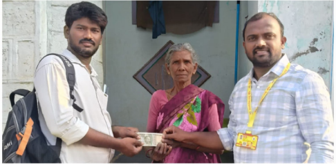
దివ్యాంగుల పెన్షను రూ.6000, మిగిలినవారికి సైతం రూ.10వేలు, రూ.15వేల వరకూ కూటమి ప్రభుత్వం