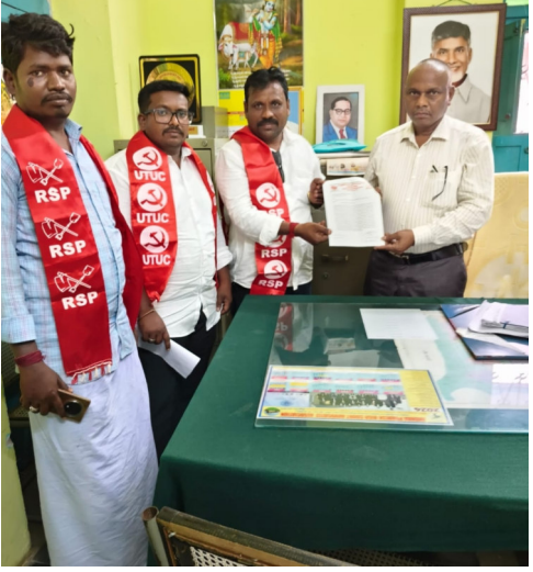
ఏ పథకాలు ఉన్నాయో వాటిని అమలు చేయాలని కోరుతున్నాం గత ఐదు సంవత్సరాల క్రితం నుండి పెండింగ్ లో ఉన్న దాదాపు 41 వేల