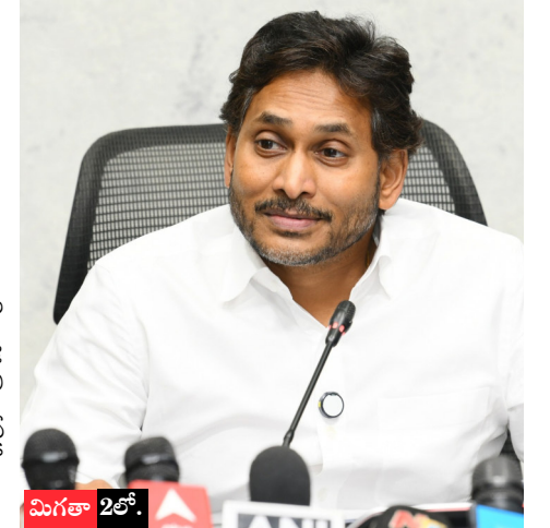
అమరావతి ఏప్రిల్ 1 రిపబ్లిక్ న్యూస్:- చంద్రబాబు లాంటి వ్యక్తి రాష్ట్రానికి ముఖ్యమంత్రిగా ఉండటం ఏపీ ప్రజలు చేసుకున్న దురదృష్టమని మాజీ సిఎం వైఎస్ జగన్ మోహన్ రెడ్డి వ్యాఖ్యానించారు. అమరావతి పేరుతో దోపిడీకి రంగం సిద్ధం చేశారని మండిపడ్డారు. అబద్ధాలు, అడ్డగోలు సంపాదన చంద్రబాబుకు తెలిసిన విద్య అని అన్నారు. చంద్రబాబుకు నిజాయితీ, చిత్తశుద్ధి లేవని, ఆయన దృష్టిలో పరిపాలన అంటే కేవలం అవినీతి, దోపిడీ మాత్రమేనని జగన్ దుయ్యబట్టారు.

అబద్ధాలు, అడ్డగోలు సంపాదన బాబు నైజం రాష్ట్రానికి రాజధాని అన్నది ఎక్కడా లేదు కేంద్రానికి మాత్రమే రాజధాని అవసరం మావిగన్ అంటూ కొత్త ఆలోచన ప్రకటించిన జగన్