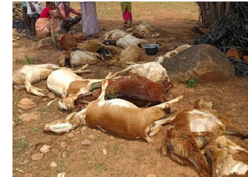
వెళ్తాయి. అక్కడ యూరియా కలిపి ఉన్న నీటిని తాగడంతో అస్వస్థతకు గురయ్యాయి.