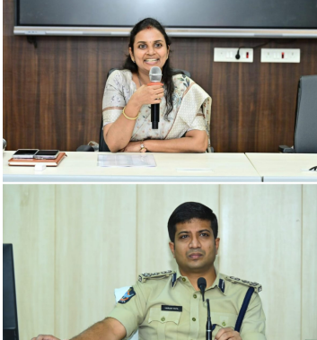
చేసి జైలుకు తరలిస్తామని హెచ్చరించారు. చెడు నడత కలిగిన మరొకరిని పేర్లు కూడా పరిశీలనలో ఉన్నాయని, ప్రజలు చట్టబద్ధంగా జీవించాలని సూచించారు.

ప్రజల్లో భయాందోళనలు సృష్టించే అవకాశాన్ని దృష్టిలో ఉంచుకుని జిల్లా బహిష్కరణ విధించినట్లు అధికారులు వెల్లడించారు. జిల్లా ఎస్సీ విక్రాంత పాటిల్ ప్రతిపాదన మేరకు క్రిమినల్ రికార్డులను సమగ్రంగా పరిశీలించిన అనంతరం జిల్లా కలెక్టర్ ఈ నిర్ణయం తీసుకున్నారు. ఈ చర్యతో కలిపి జిల్లాలో ఇప్పటివరకు మొత్తం 9 మందిపై జిల్లా బహిష్కరణ ఉత్తర్వులు అమలు చేసినట్లు తెలిపారు.