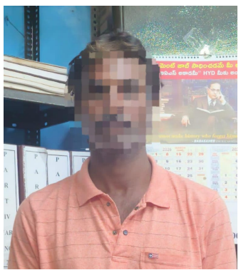
హత్యలకు సంబంధించిన కేసుల్లో పాల్గొన్నట్లు గుర్తించారు. గతంలో పలుమార్లు రిమాండ్ కు వెళ్లినప్పటికీ అతడి ప్రవర్తనలో మార్పు రాకపోవడంతో ఈ సందర్భంగా ఎస్సీ మాట్లాడుతూ, శాంతిభద్రతలకు భంగం కలిగించే వారిపై కఠిన చర్యలు కొనసాగుతాయని స్పష్టం చేశారు. అవసరమైతే టీడీ యాక్ట్ సమూహ చట్టబద్ధంగా జీవించాలని సూచించారు.