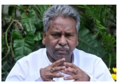
మృతి చెందిన కావూరి సాంబశివరావు (వైఎస్ఆర్ పార్టీ)