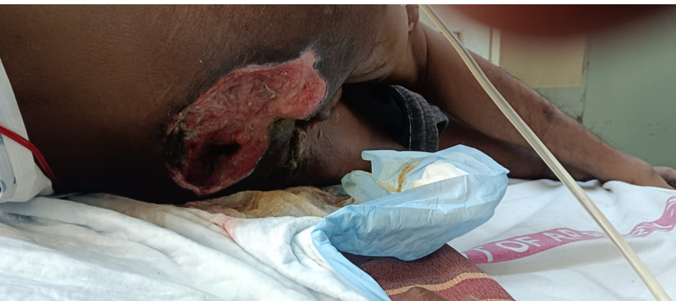
పెద్ద గోతిగా ఏర్పడిన నడుము భాగం (ఫైల్ ఫోటో)

పెళ్లిడుకొచ్చిన కొడుకు ఇంటికి పెద్ద దిక్కుగా ఉండి కుటుంబాన్ని పోషిస్తున్నాడు. కూరగాయలను వివిధ కూరగాయల మార్కెట్లలో తీసుకు వెళ్లేందుకు కూలి పనికి వెళ్లే వాడు. ఉన్న ఊరు కాదని జిల్లా సరిహద్దులు దాటి వివిధ ప్రాంతాలకు కూలి పనికి వెళ్తూ.. వచ్చిన డబ్బుతో కుటుంబాన్ని పోషిస్తూ కన్న తల్లిదండ్రులకు