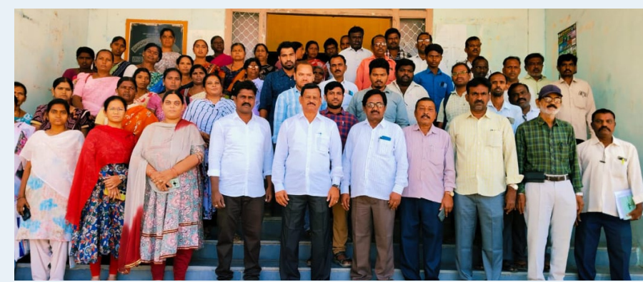
చిప్పగిరి, మార్చి 11, (లపజ్జక్ సన్మాన్)