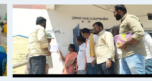
చిప్పగిరి, మార్చి 11, (లపజ్జక్ సన్మాన్)