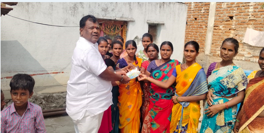
ఆంధోల్ ప్రతినిధి జనవరి 31