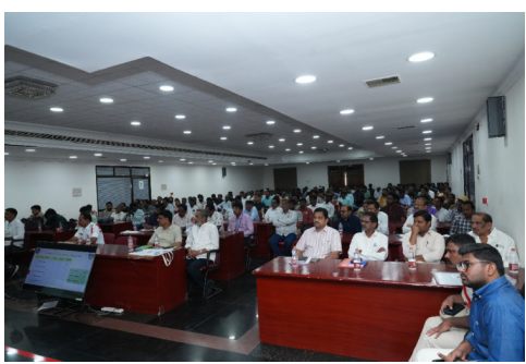
“ఒక్క ప్రమాదం కూడా జరగకుండా, ప్రతి ప్రయాణం సురక్షితంగా ఉండాలి” అన్నది రోడ్డు సీట్ల మిషన్ ఆశయం.

రోడ్డున పడకుండా కృషి చేద్దామని తెలిపారు. రోడ్డు సీట్ల మిషన్ ఉద్దేశ్యం రోడ్డు ప్రమాదాలను తగ్గించడం, ప్రజల్లో రోడ్డు భద్రతపై అవగాహన పెంచడం దీని ప్రధాన లక్ష్యం. సంక్లిష్టంగా చెప్పాలంటే రోడ్డు ప్రమాదాల్లో మరణాలు, గాయాలు తగ్గించడం ట్రాఫిక్ నిబంధనలను కచ్చితంగా పాటించేలా ప్రజలను ప్రోత్సహించడం. సురక్షిత ప్రయాణం సంస్కృతిని పెంపొందించడం రోడ్డు సీట్ల మిషన్ విధి విధానాలు ముఖ్యమైన పనులు ప్రజలలో అవగాహన కార్యక్రమాలు. రోడ్డు సీట్లపై శిక్షణలు, వర్క్ షాపులు... స్కూల్స్, కాలేజీల్లో అవగాహన తరగతులు, షోర్ట్లు, వీడియోలు, ర్యాలీల ద్వారా ప్రచారం, డ్రైవర్లకు కంటి పరీక్షలు నిర్వహణ ఇలా పలు కార్యక్రమాలు చేపట్టేలా ప్రణాళికాబద్ధమైన కార్యాచరణ సిద్ధం చేశారు. ట్రాఫిక్ నిబంధనల అమలు హెల్మెట్, సీట్ బెల్ట్ వాడకం పై చర్యలు, మద్యం సేవించి వాహనం నడపడం పై నియంత్రణ, ఓవర్ స్పీడింగ్ పై చర్యలు. రోడ్డు మౌలిక సదుపాయాల మెరుగు ప్రమాదకర మలుపులు, ఖాళీ స్పాట్స్ వద్ద వాహనదారులను అప్రమత్తం చేయడం. సైన్ బోర్డులు, జిల్లా ట్రాఫిక్, స్పీడ్ బ్రేకర్లు ఏర్పాటు... ప్రమాదాలపై డేటా సేకరణ & విశ్లేషణ... ఏ ప్రాంతాల్లో ఎక్కువ ప్రమాదాలు జరుగుతున్నాయో గుర్తించడం, వారికి తగిన పరిష్కారాలు సూచించడం ప్రమాదానంతర సహాయం అంబులెన్స్ సేవలు వేగంగా అందేలా చూడటం గాయపడిన వారికి తక్షణ వైద్య సహాయం అందించడం ముఖ్య ఉద్దేశం.