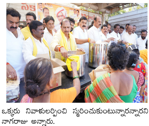
ఒక్కరు నివాళులర్పించి స్మరించుకుంటున్నారని నాగరాజు అన్నారు.